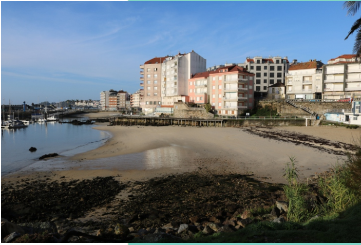
Praia da Panadeira