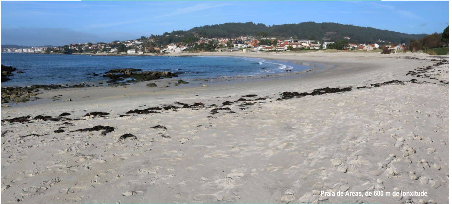
Praia de Areas, de 600 m de lonxitude