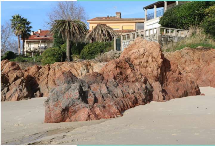
Rochas na praia de Areas