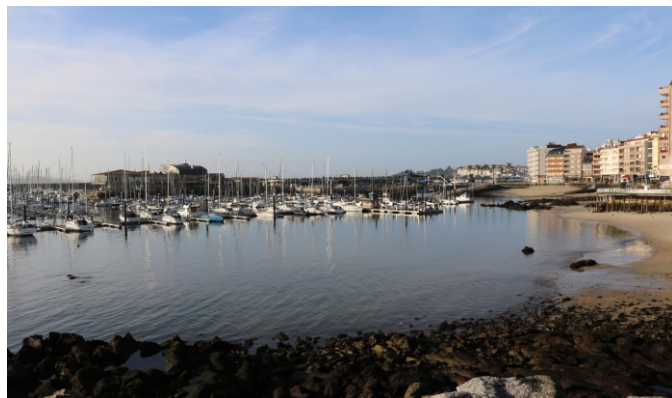
Praia dos Barcos. Porto deportivo.