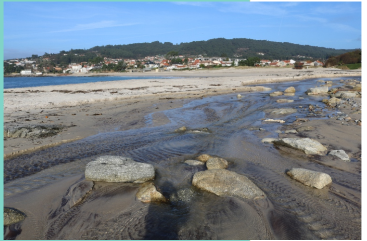
Rego de Dorrón, na praia de Areas