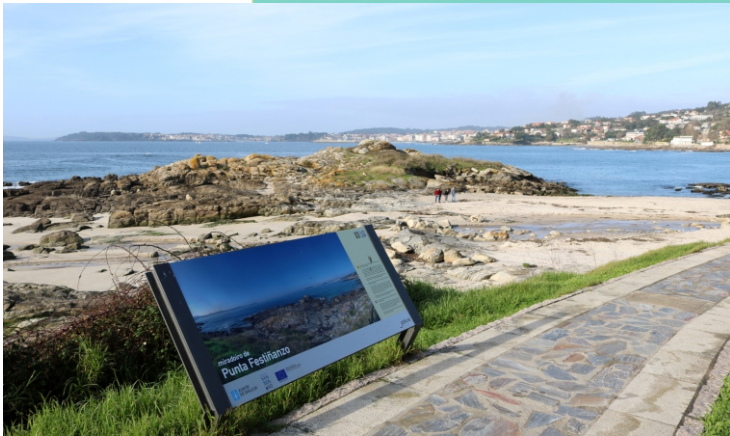
Illote de Areas ou do Laño