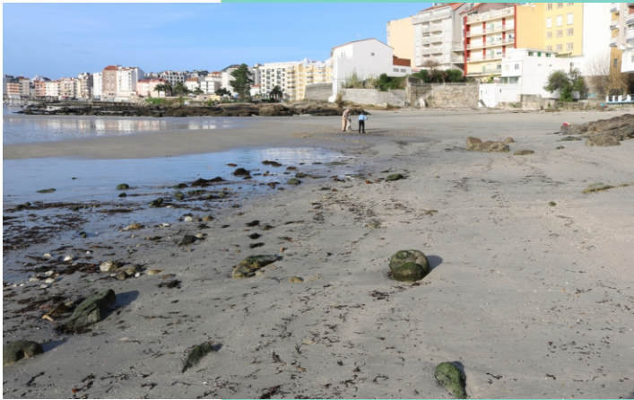
Praia da Carabuxeira