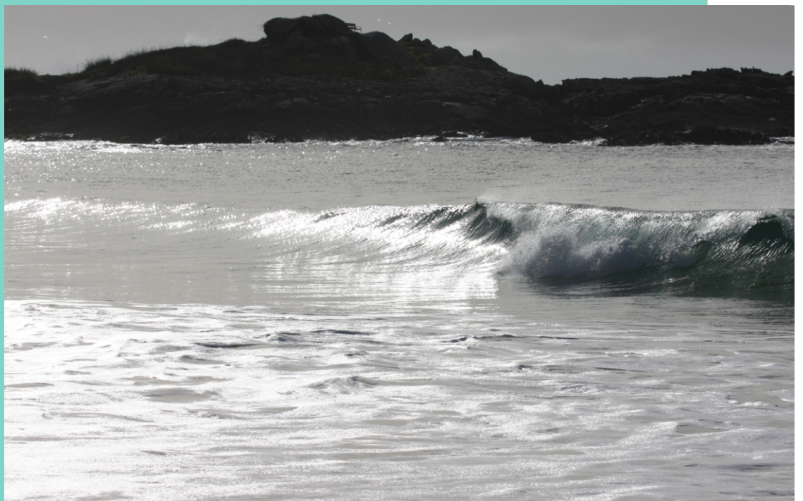
Ondas na praia de Areas