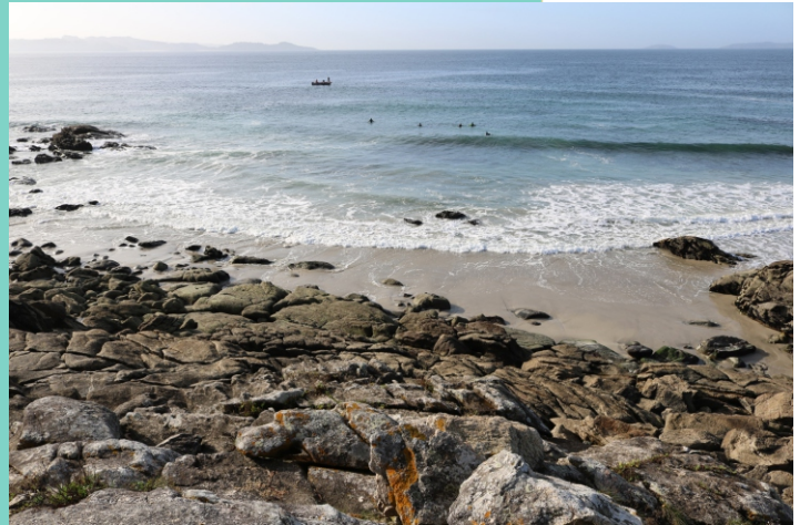
Praia Area dos Mortos