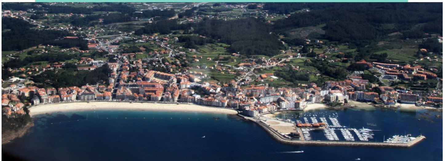
Vistas aéreas da costa de Sanxenxo a Areas