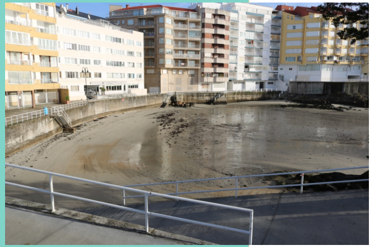
Praia de Lavapanos