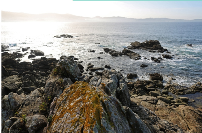
Punta de Festiñanzo