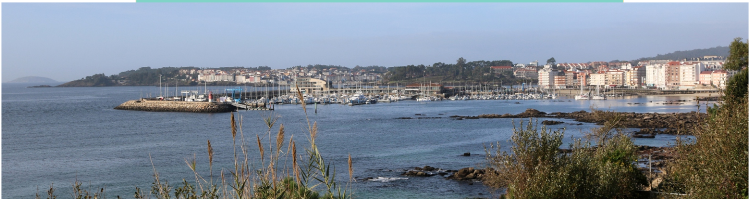
Vista de Sanxenxo desde o miradoiro de Palacios