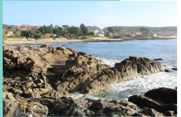
Praia e punta de Barreiros