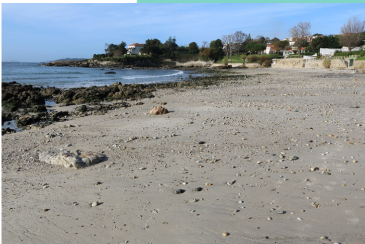
Praia de Nanín